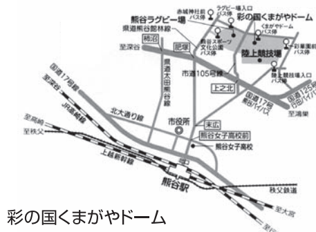
彩の国くまがやドーム