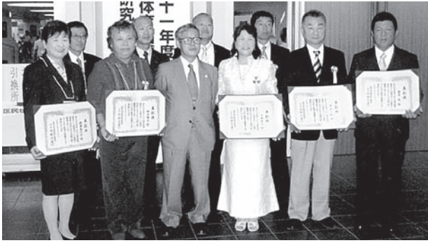
関東体育指導委員協議会表彰