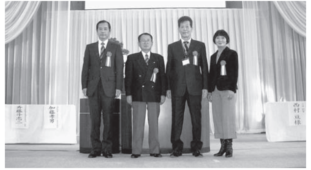
文部科学大臣表彰