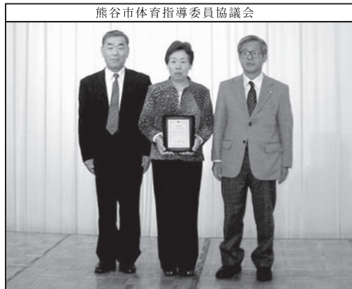
全国体育指導委員優良団体表彰