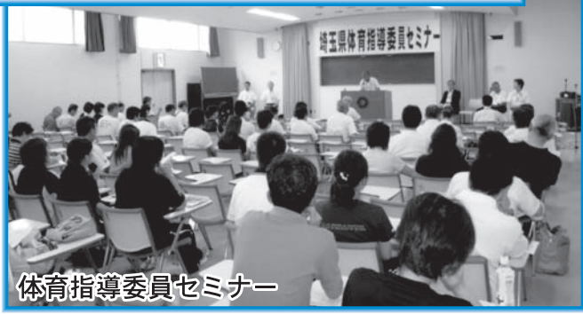
体育指導委員セミナー