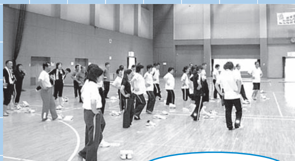
体力テスト認定講座